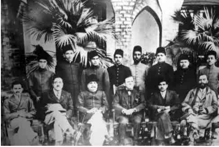
İkbal Pencap Üniversitesi'nde akademisyen ve talebelerle

جوانوں کو مری آہ سحر ہے پیرانہ شہیں انھوں کو نالی بہرہ مدنیہ آرزو میری یہی ہے مرا توڑ لہیرت عام کر دے ! قریب