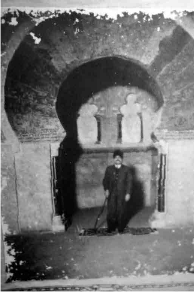
İktbal Kurtuba Camii'nde