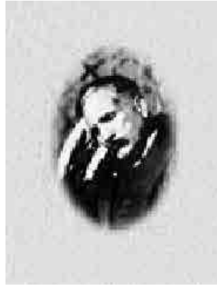
İkbal'in karakteristik bir portresi