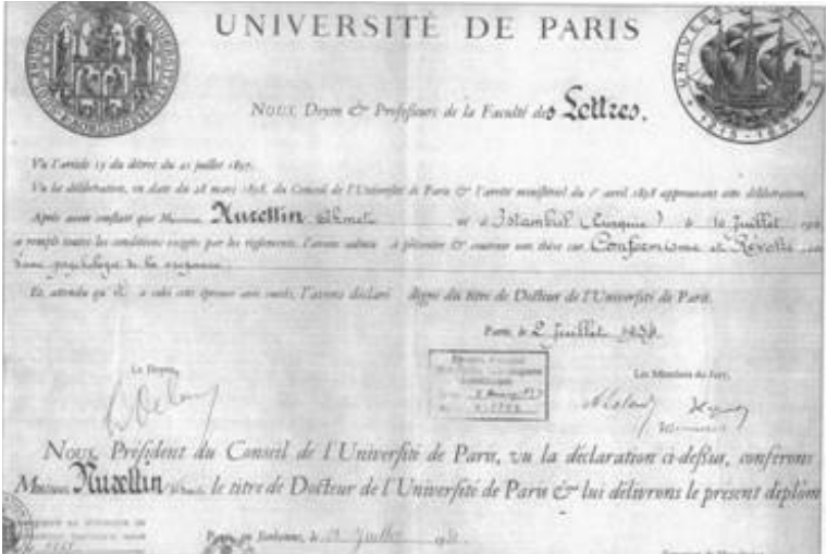
Sorbonne Üniversitesi'nden Almış Olduğu Doktora Diploması