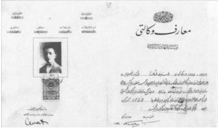
İstanbul Erkek Lisesi'nden Almış Olduğu Lise Diploması