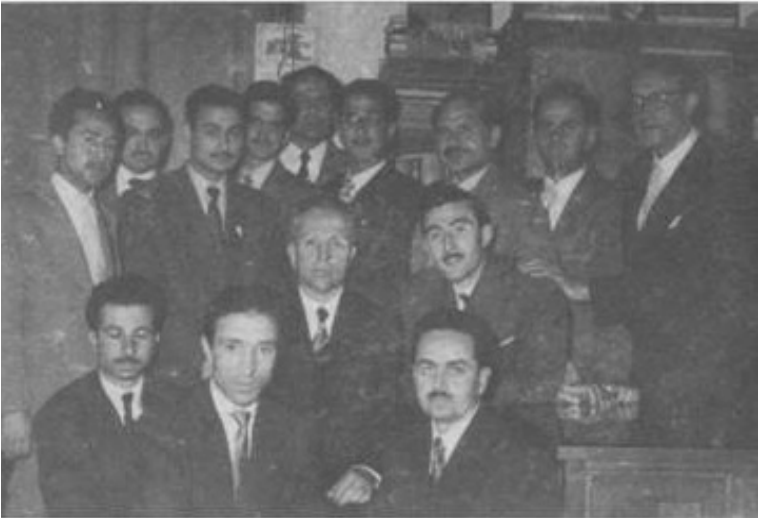
Arkadaşları ve Öğrencileriyle