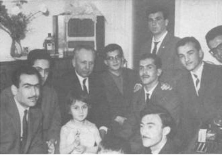
Evde Yakınları ve Arkadaşlarıyla