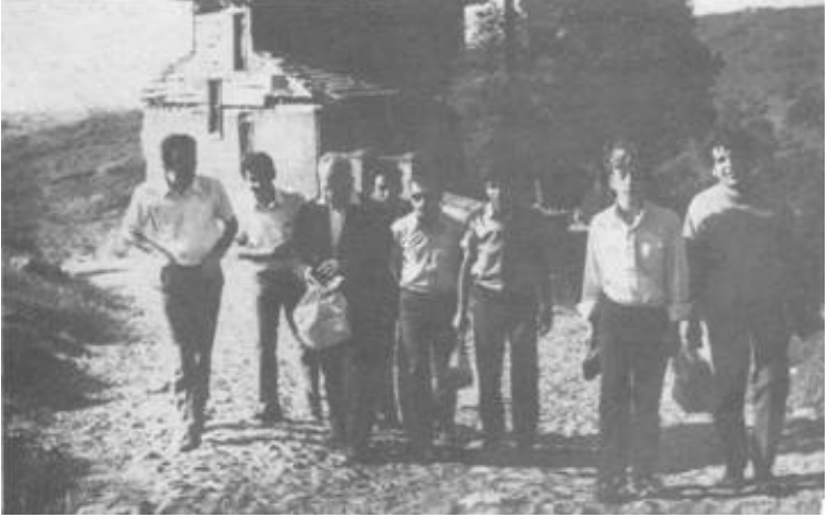
Bir Gezide Arkadaşları ve Öğrencileriyle