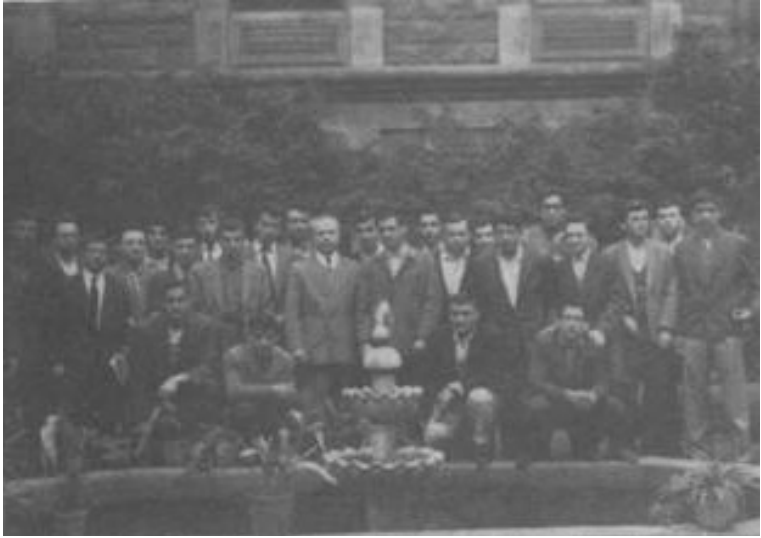
Vefa ve İstanbul Liseleri'nde Öğretmenlik Yılları