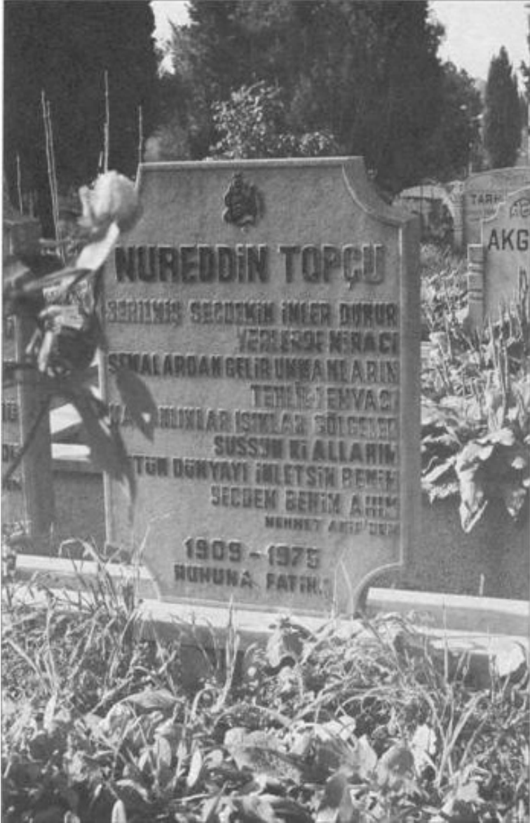
Kozlu Kabristanlığı'ndaki Mezar Taşı