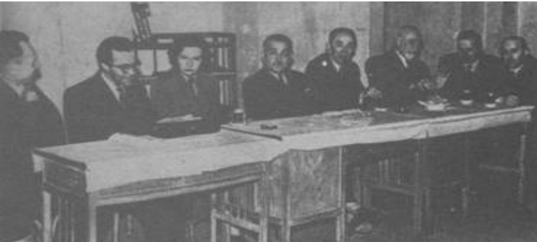
Türk Milliyetçiler Derneği Toplantısında (sol başta) 1 Nisan 1952