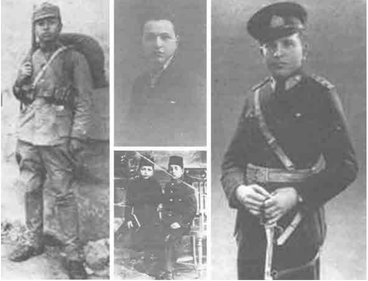
Gençlik ve Askerlik Fotoğrafları