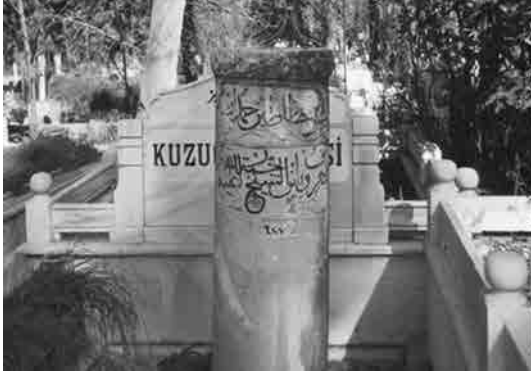
Şeyh Hamdullah'ın mezar taşı

Niyazımız odur ki; sadece İslâm yazısına has olan, hem okunup ibret alınan hem de mücerret (abstre) bir resim tablosu gibi duvara asılıp tefekkür edilen ve modern resmin öncülerinden Picasso'ya: "Benim resimde varmak istediğim son noktayı İslâm yazısı çoktan bulmuş" dedirten bu sanatımızı, yeniden aslına uygun bir şekilde ihya edip geliştirelim ve bu hat dâhisini aşan, gerçek sanatkârlar yetiştirerek büyük Şeyh'in ruhunu şâd edelim.