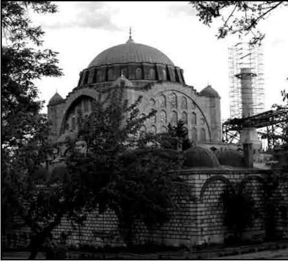
Edirnekapı Mihrimah Sultan Camii

pencere kullanarak, bir ışıklı perde haline getirerek, hem yapının içinde, hem dışında olağanüstü bir mimarî kafes haline sokar. 19. yüzyılın ikinci yarısında yapılan tek kubbeli, baroksu camilerin bir ölçüde başarabildiği ışıklı, tek kubbeli mekan etkisi, Edirnekapı’da, 35 metreye yükselen tek kubbenin altında, onlardan 300 yıl önce, yaratıcı bir biçimsel uygunluk içinde gerçekleşmiştir.”