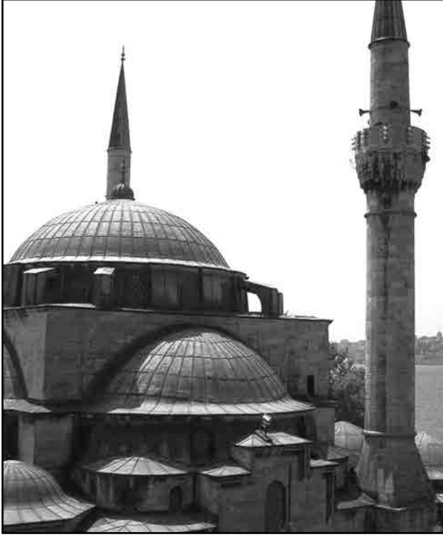
Üsküdar Mihrimah Sultan Camii