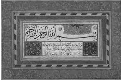
Şeyh Hamdullah'ın hatlarından biri

Hatlar ki güftesi ve bestesiyle Şakırlar bir kamış kalemin sesiyle Selahaddin Batu