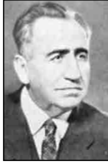
Mazhar Osman'ın portresi

Mecnun ile bahs etmeğe gitti ukalâmız Var ana kıyas eyle ne söyler budalamız İzzet Molla