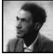
Yesârî Âsım'ın portresi

Hazret-i Âsım Yesârî bestekâr-î zî-hüner Tutmuş âfâk-î cihânî şöhretî şam'ü seher Yed-i tülâ sâhibî o mûsikîde bî-menend Beste-î bercestedir her bestesi dürr'ü güher İsmail Hakkı Özkan