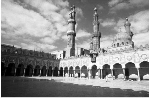
Ezher Üniversitesi ve Cami-i Şerifi