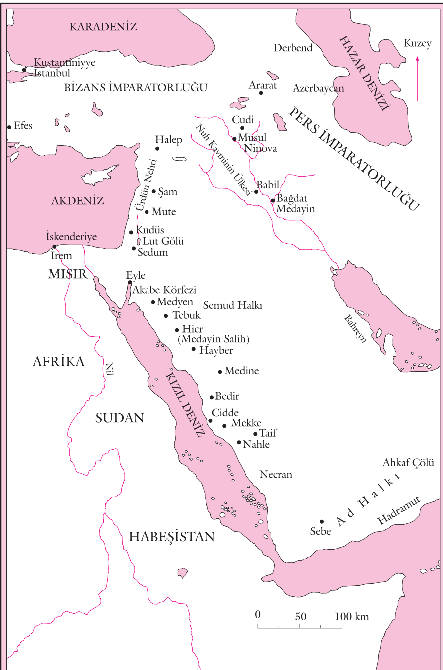
Kitapta adı geçen başka yerleri gösteren harita