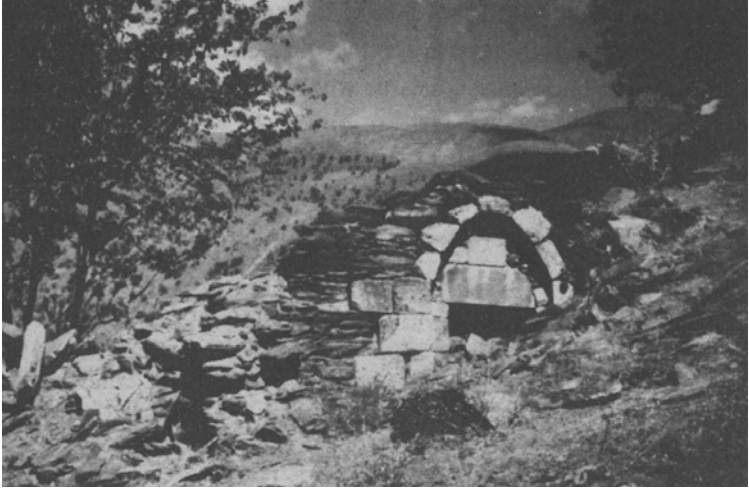
Üstadın ilk tahsilini almaya başladığı Nurs köyü yakınlarındaki Tağ Medresesi harabeleri.