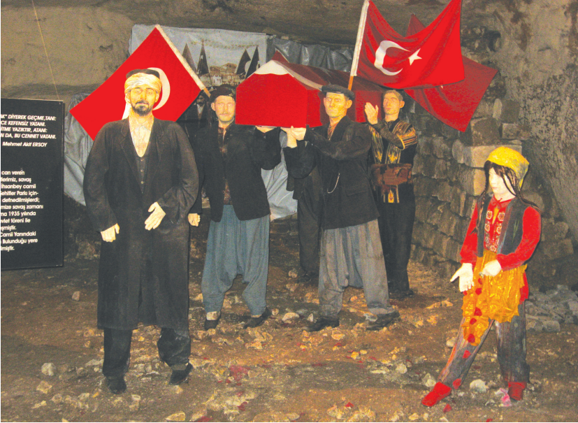
Gaziantep Savaş Müzesi'nde şehit cenazesini gösteren temsili bir fotoğraf