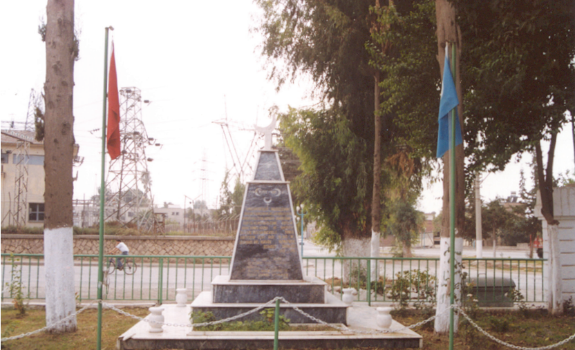
Tarsus'ta Şehit Yolbars ve arkadaşları için yapılan anıt. Kabirleri Tarsus Mezarlığındadır.