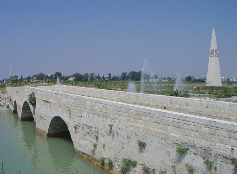
Tarsus'ta Molla Kerim'in şehit edildiği köprü ve yanındaki Anıt. (Bugün Kuva-yı Milliye Parkı içindedir.)