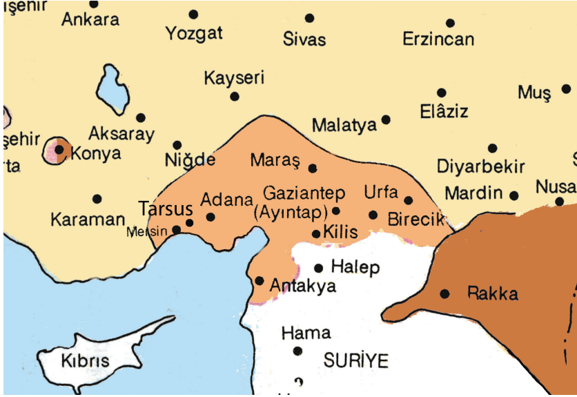
Fransız işgal bölgesi