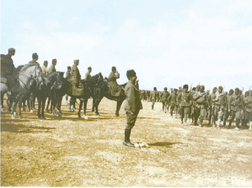
Başkomutan Mustafa Kemal Paşa, Işın'da orduyu selamlıyor