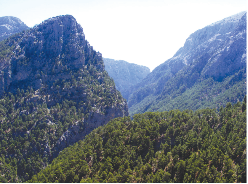
Toroslarda Çakıt Vadisi