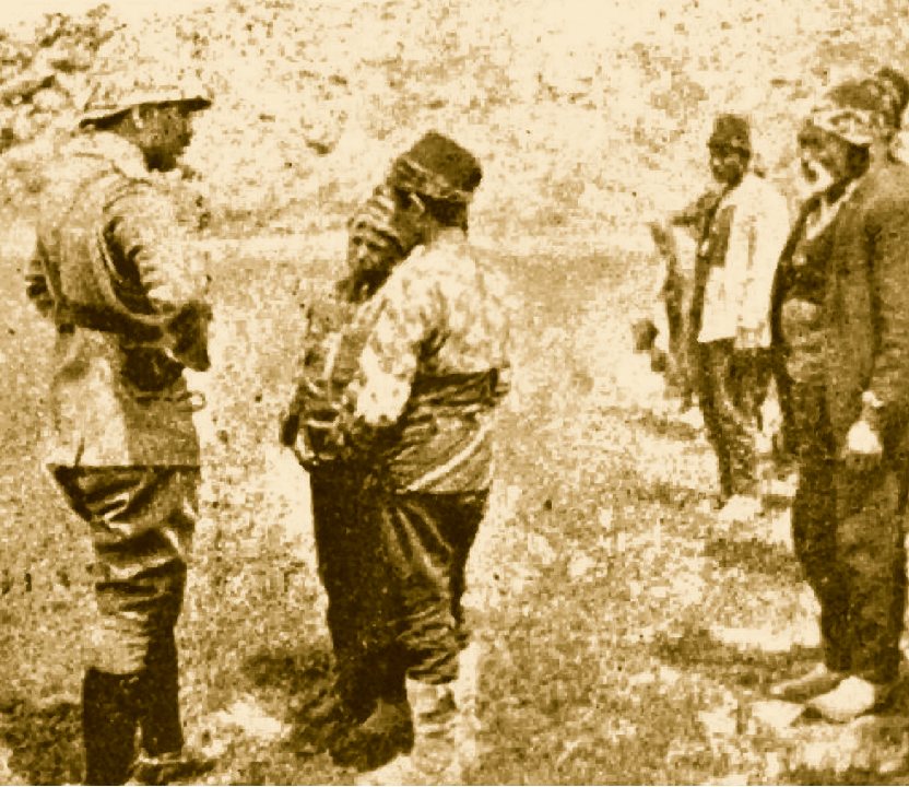
I. Dünya Savaşı öncesi cepheye gönüllü gitmek için kumandanla konuşan çocuklar