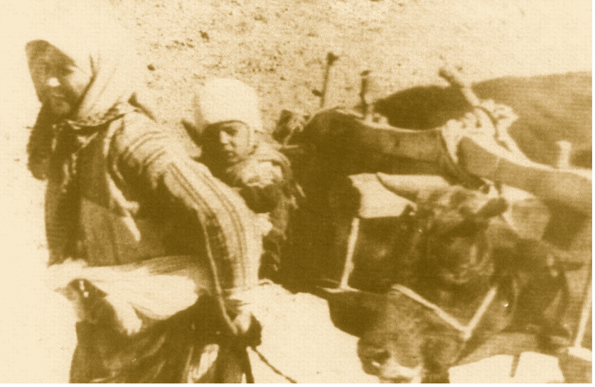
Cepheye mühimmat nakliyatı