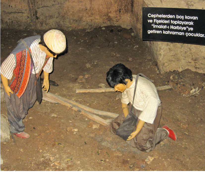
Gaziantep Savaş Müzesi'nde cepheden boş kovan toplayan çocukları gösteren temsili bir fotoğraf