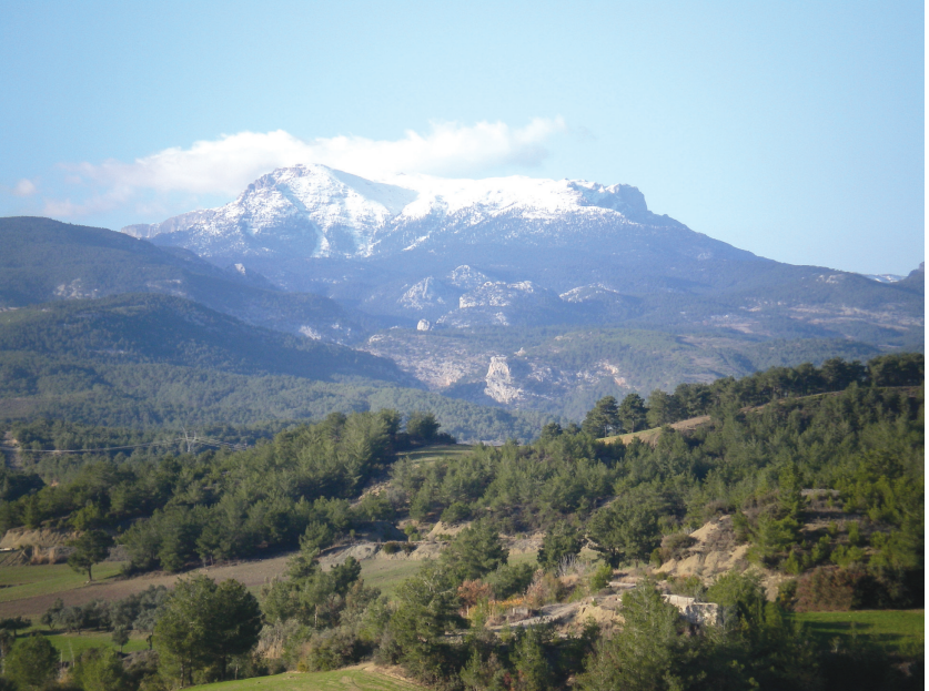
Karaisalı'dan Torosların görünüşü