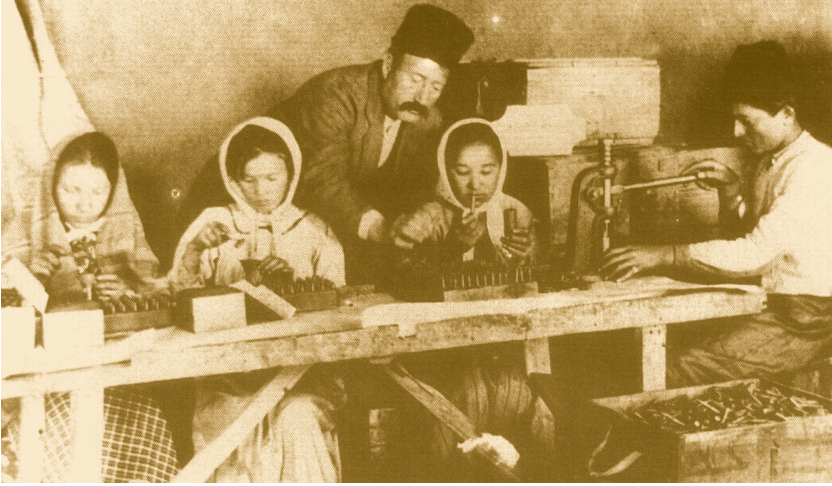
İmalat-ı Harbiye Atölyelerinde fişek dolduran çocuklar