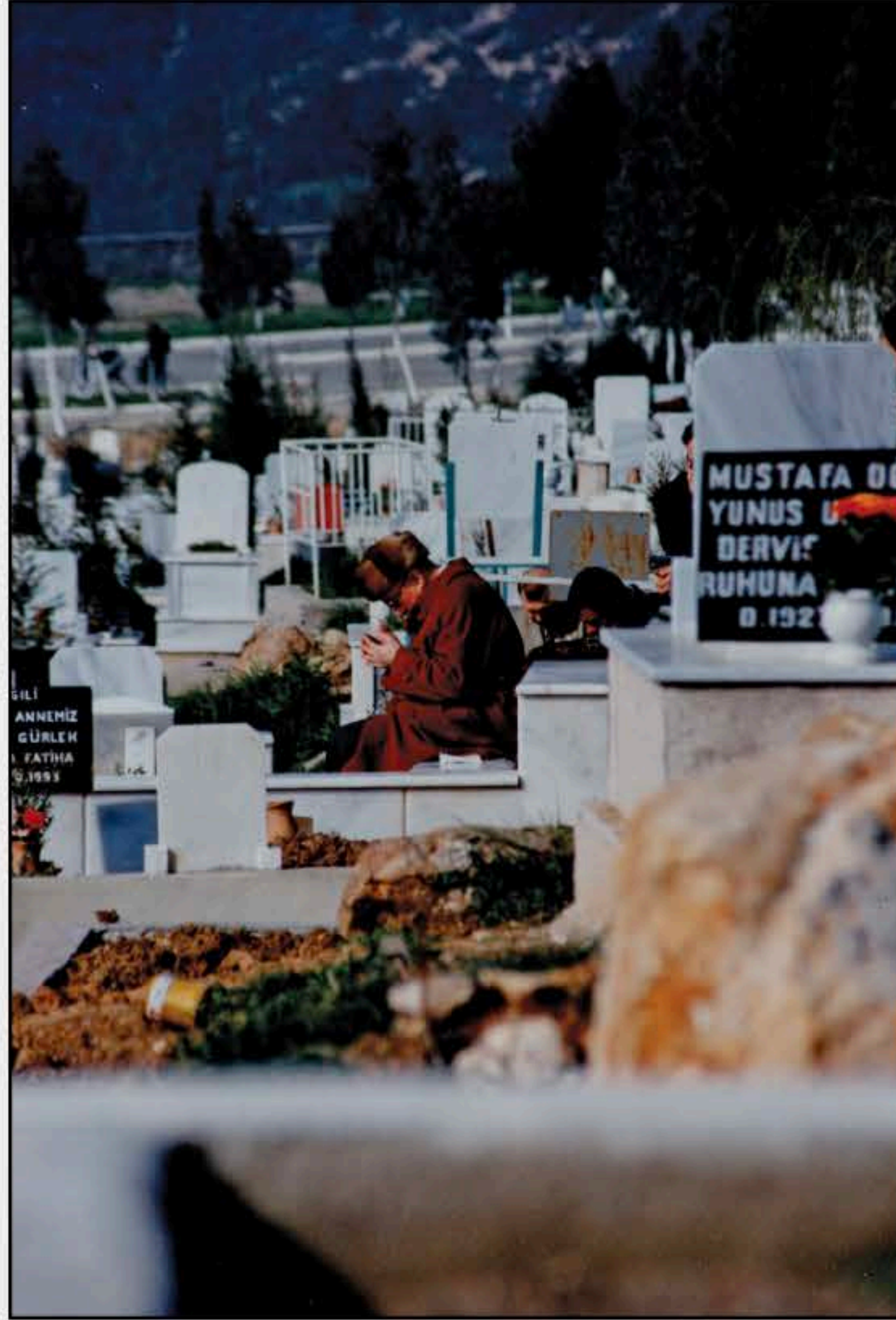
11-İzmir Örnekköy mezarlığında annesinin kabri başında dua ederken.