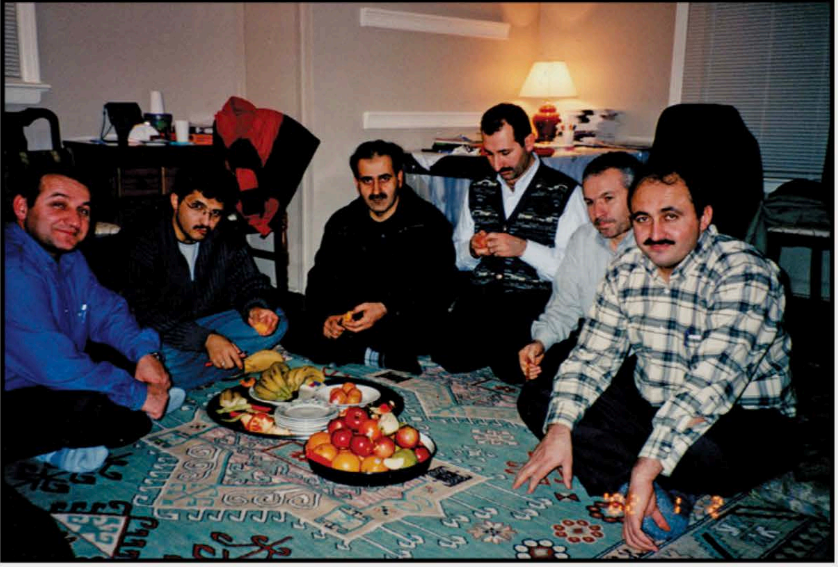
4-Amerika'da bir grup ders arkadaşımızla meyve yerken.