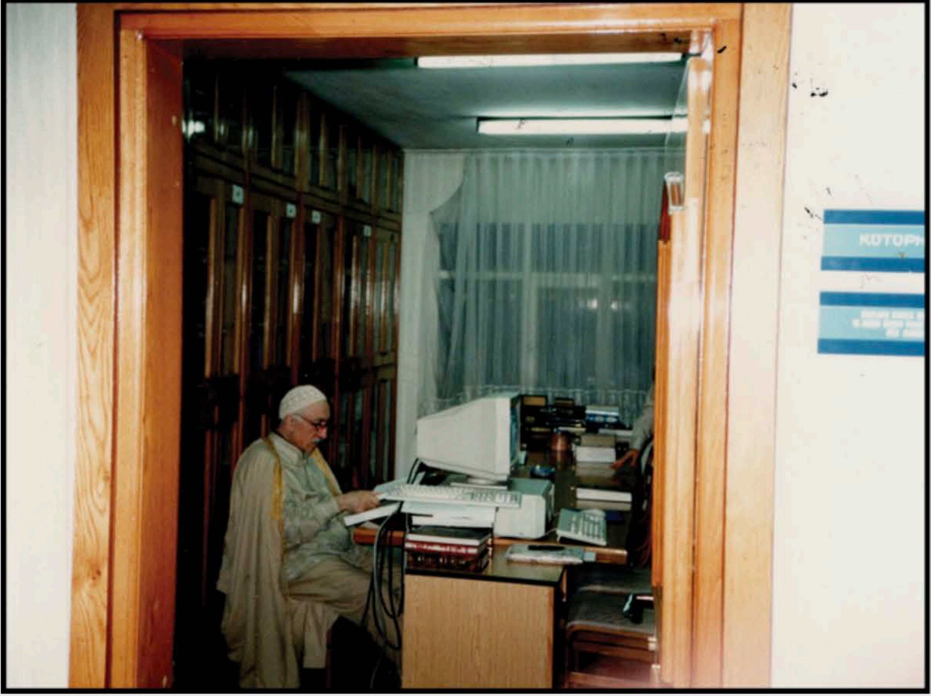
15-İstanbul'da odasında çalışırken.