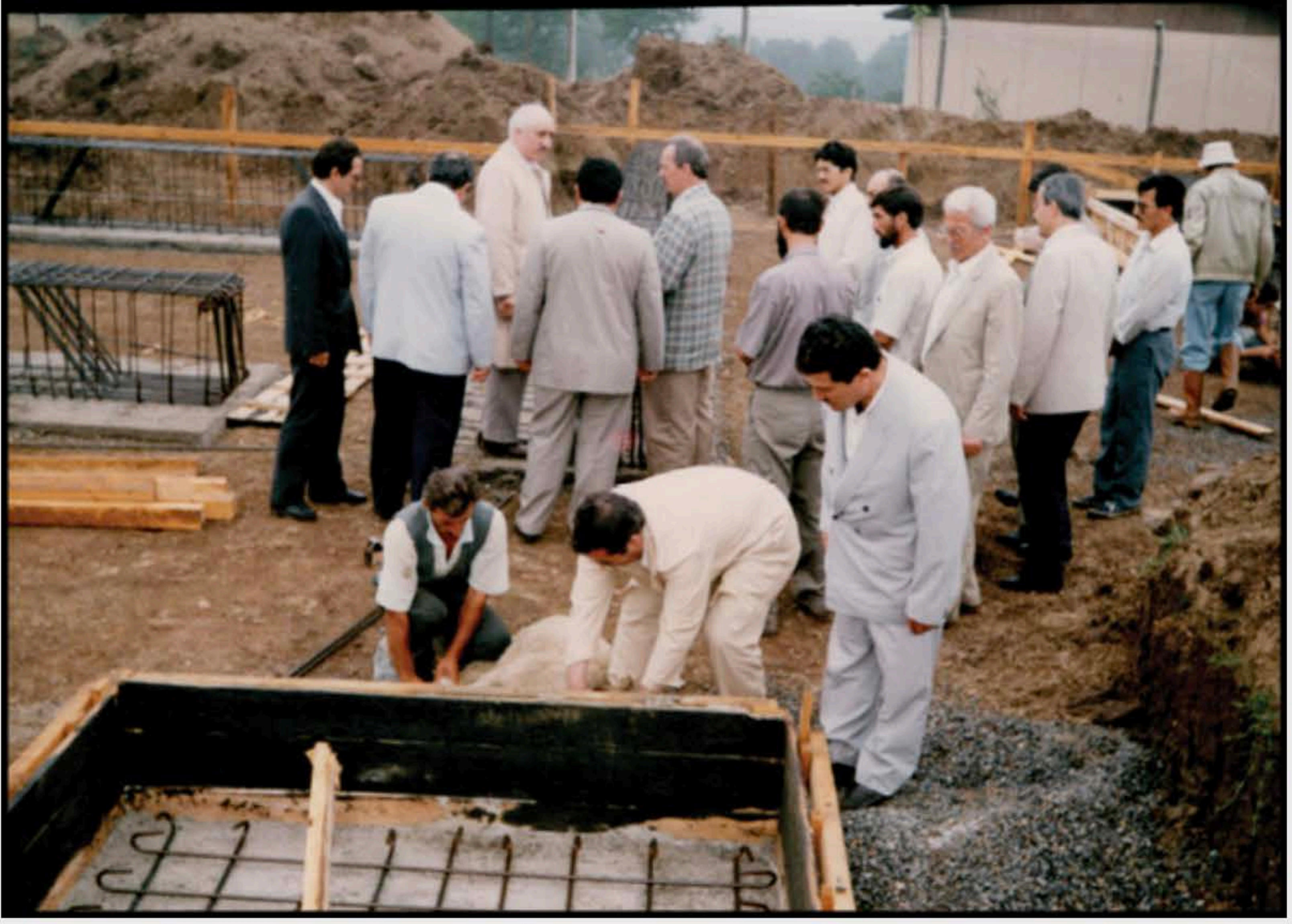
7-İzmit'te kolej temel atma töreni.