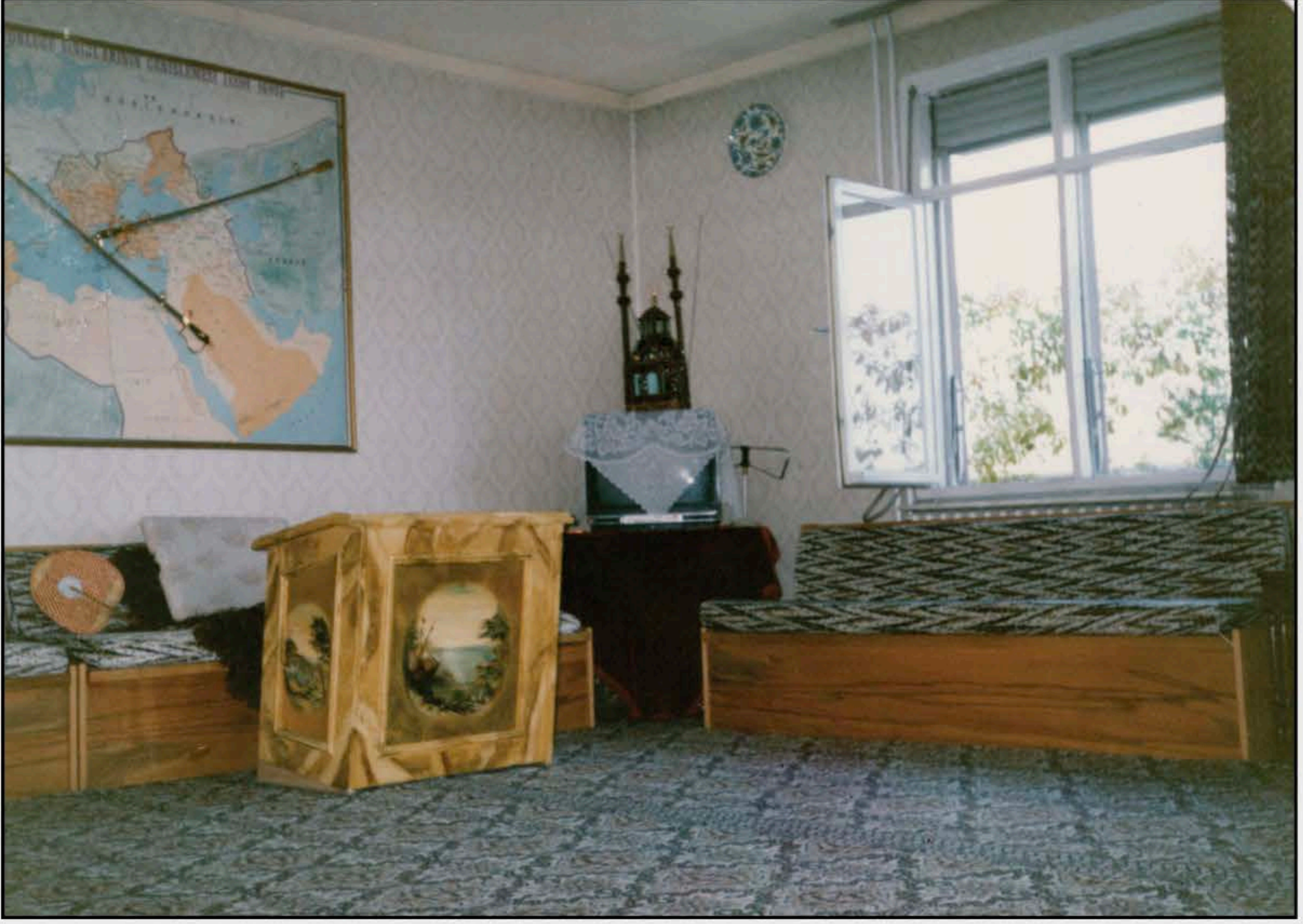
12-Altunizade FEM salonunun eski hali.