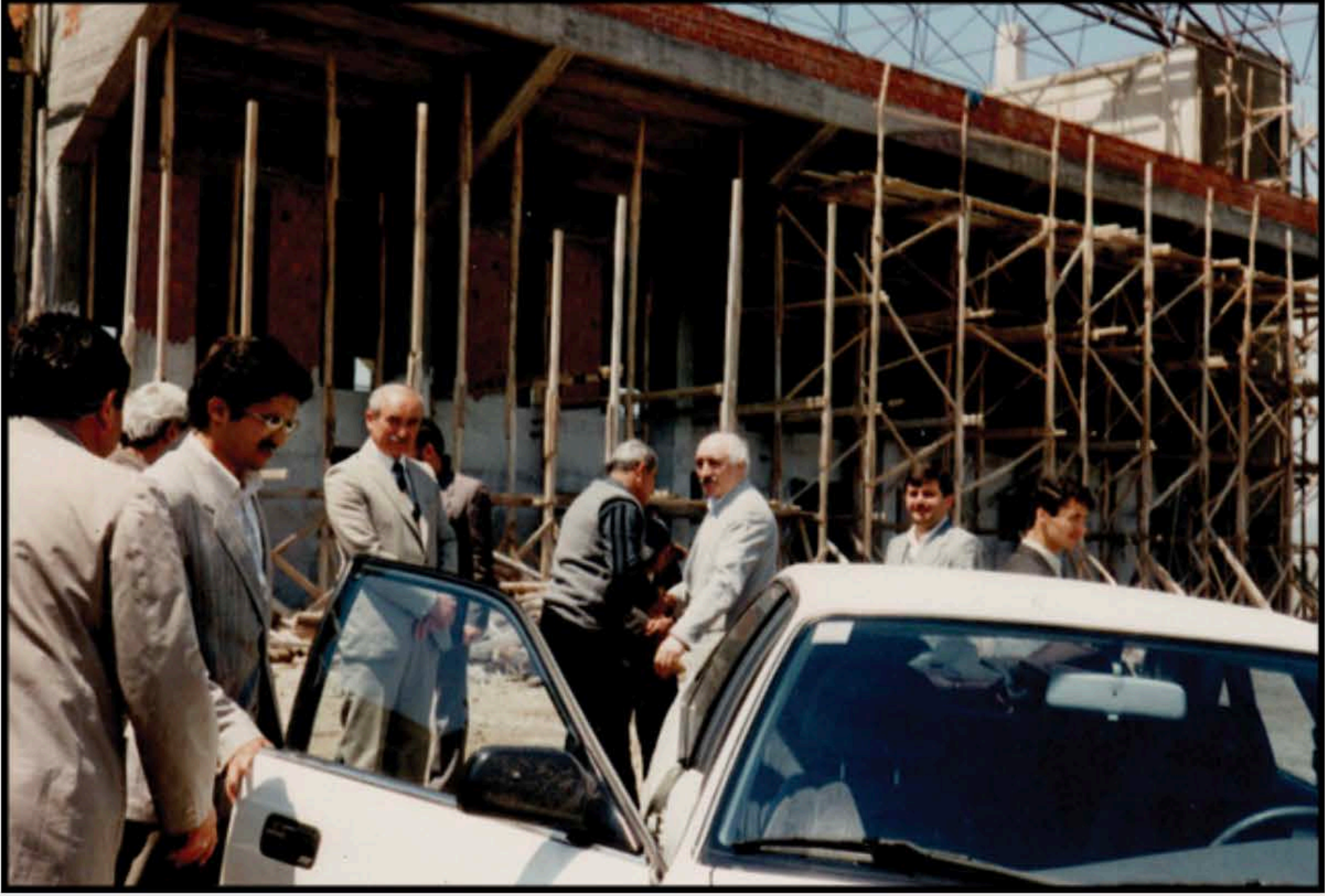
9-Tavşanlı Yavuz Selim koleji inşaatı ziyaretinde.