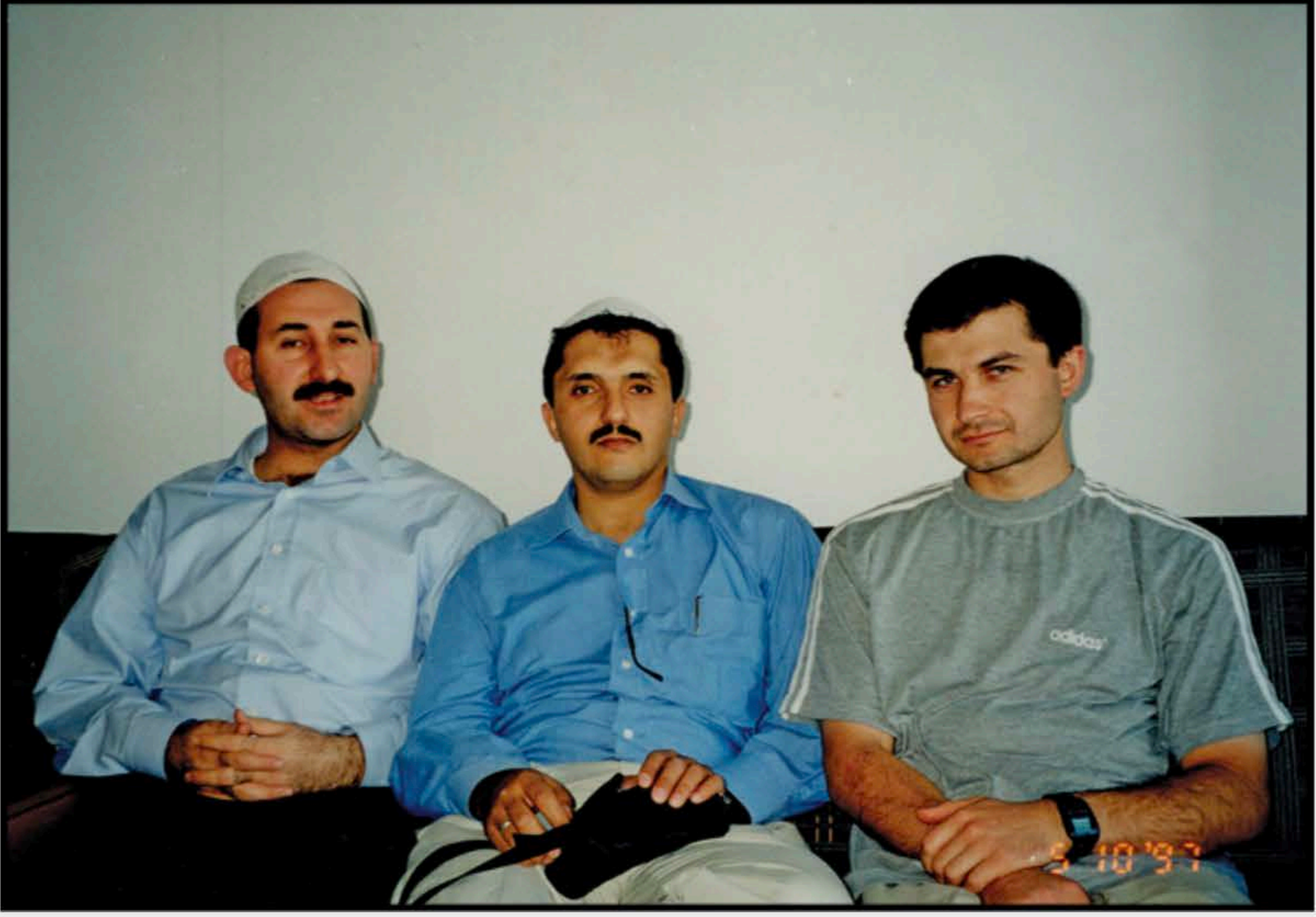
3-İstanbul Altunizade yılları