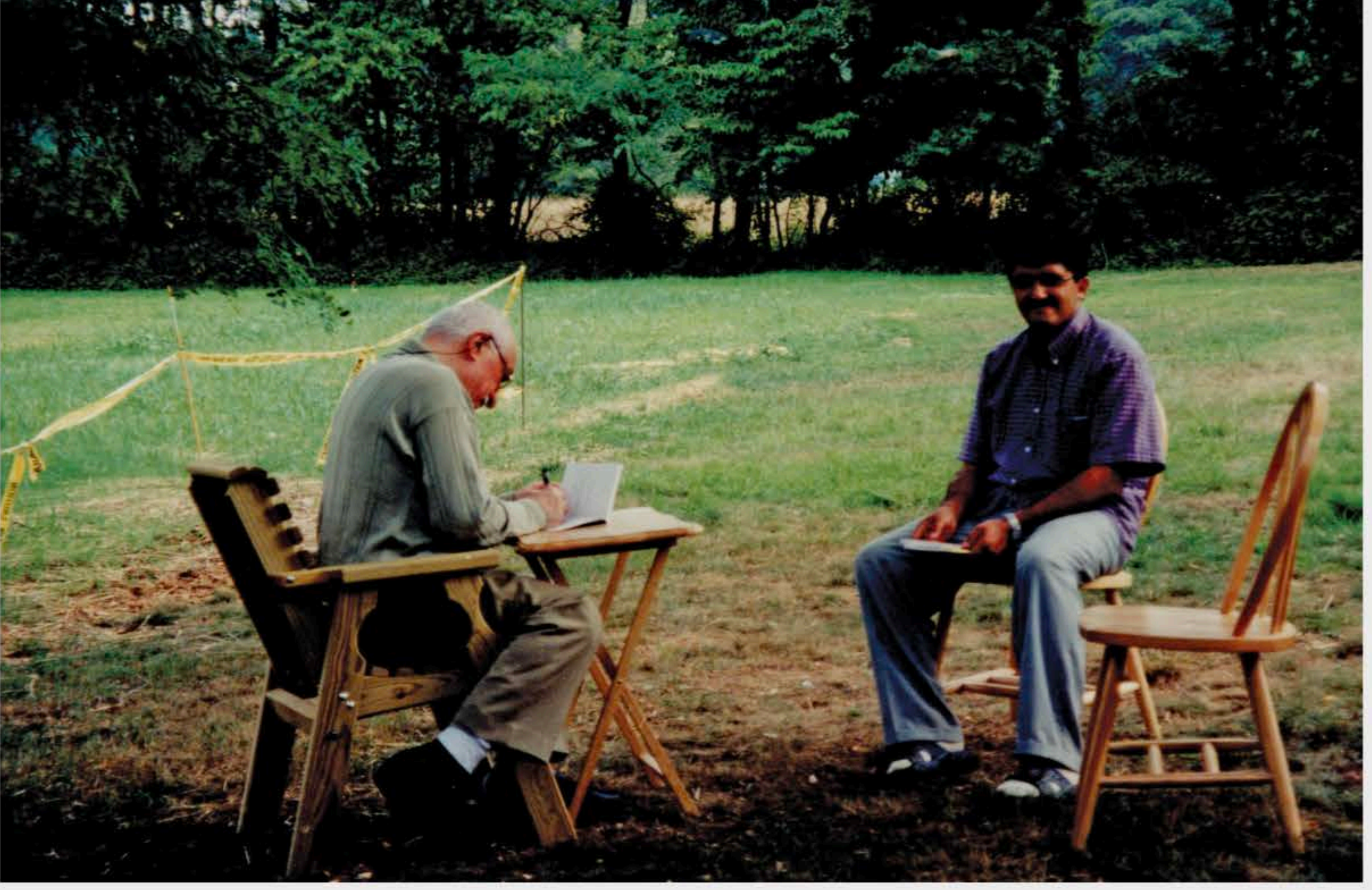
1-Camp Chesnut bahçesinde kitap imzalarken.