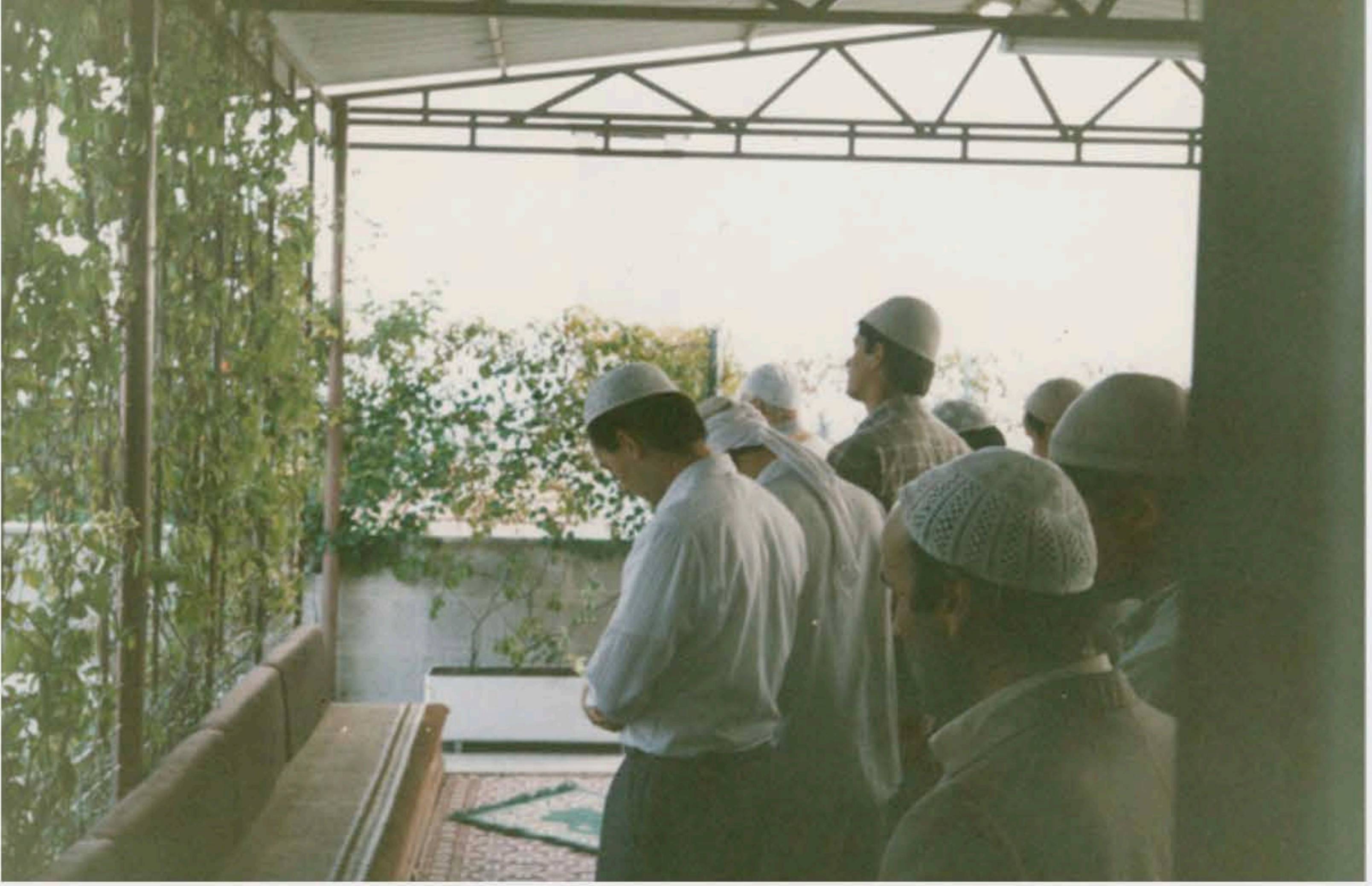
10-İzmir Bozyaka'da bir namaz esnasında.