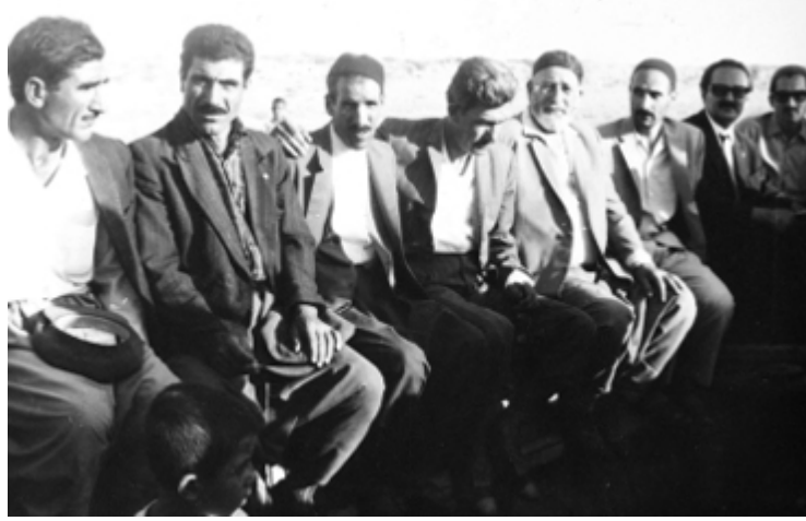
Anadolu'da maznunlar kervanı arasında...