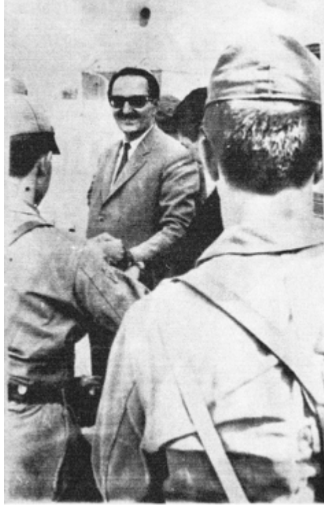
Kelepçeleri çözen adamın eline kelepçe vurulurken...