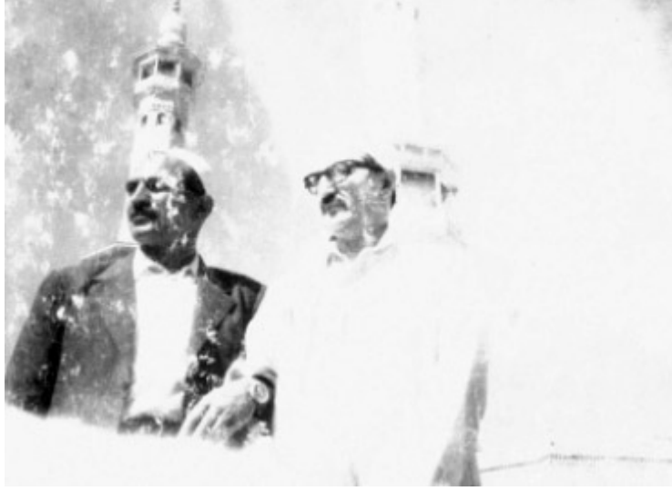
Bir dostuyla Mescid-i Haram'da...