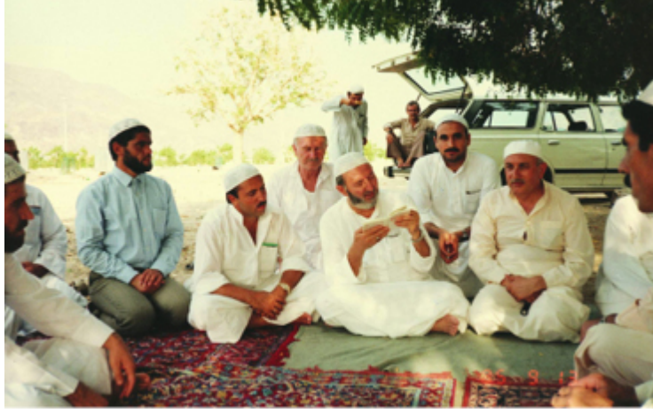
Arafat'ta hacılarla birlikte...

Biraz düşündü. “Peki” dedi ve razı oldu. Anladı ki kararlıyım! Sonradan olsa dinlemez. Emreder ve biz de boyun eğdik.