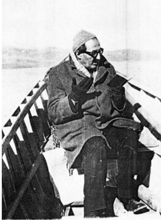
Kayıtta Cevşen okurken...