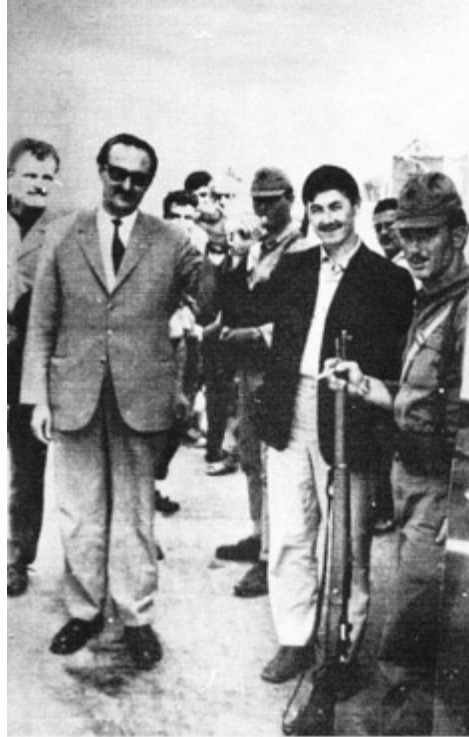
Belâ yüzüne gülerek belâyı küçültenler...

Ben ev sahibi olduğum için namazı bozarak kapıyı açtım. Resmî ve sivil 30 kadar polis, şikâyet olduğunu, evin aranacağını söylediler. Ben de arama belgesini sordum ve “Misafirlerim namaz kılıyorlar, namazdan sonra ararsınız.” dedim.