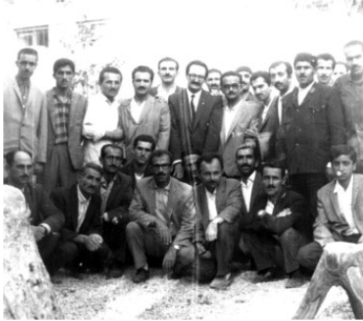
Bir grup maznunla birlikte...