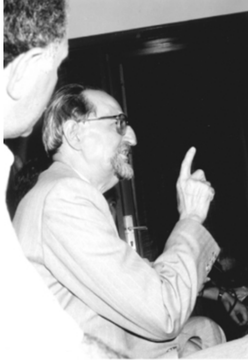
Bir ömrü hakkın müdafaası ile geçirmiş insan...

“İman küfür mücadelesinde hareketleri küfür hesabına geçenlerle olduğu kadar, hatta müdafaa ettiklerinizin şu veya bu sebeple veya anlayışsızlıkları veya hamakatlara veya hani birbirini inkâr eden Allah adamlarının birbirlerini kabul etmemelerinin Allah yanındaki niyete ve değere zarar vermeyeceğini hesaba katarak, İslâmın zaferi için hizmete devam etmek lâzımdır. Ağzular torba olmadığı gibi, kalpler ve duygular da çekilip bükülemez.” (Necmettin Şahiner, Hak ve Hakikatin Müdafii Av. Bekir Berk , s. 150-151)