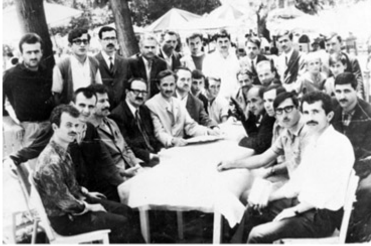
Bir mahkeme sonrası beraat eden maznunlar ve dostlarla...