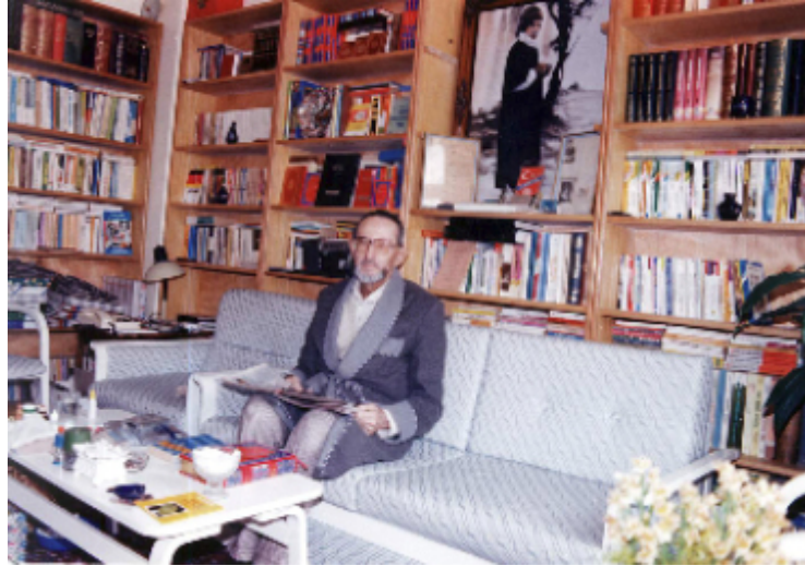
1990'lı yıllarda İstanbul Fatih'te ikamet ettiği evinde...

Böylesi politik temaslar eleştirildiğinde Bekir Berk gönül koydu. Oysa toplumdaki gelişim ve değişim ciddî boyuttaydı. İstenilen hacimde veya boyutta kalmıyordu. İşte bundan dolayı görüş ayrılıkları yaşadı.