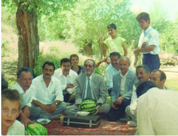
Ömrünün son yıllarında Anadolu’daki dostlarını ziyaretlerinden biri...

“Ey Everest Tepesindeki çiçeğe rengini veren Rabbim! Ey okyanusun derinliklerindeki balığın rızkını veren Allah’ım! Bana iki sene daha müsaade ver. Kardeşlerimle buluşup kucaklaşayım, hasret gidereyim. Ondan sonra ruhumu al.”