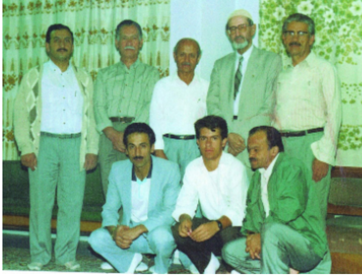
Son yıllarında Anadolu'daki dostlarımı ziyareti esnasında...