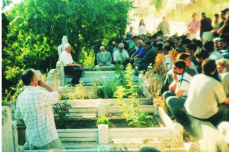
Mezarı başında dualarla anılırken...

“Nur'lara dalmadan ümit güneşinin sıcaklığını hissetmek, imkânsız.”