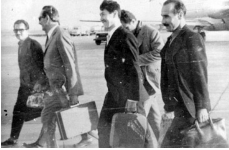
İzmir Sıkıyönetim Mahkemesinden tahliye sonrası uçağa binmeye giderken...