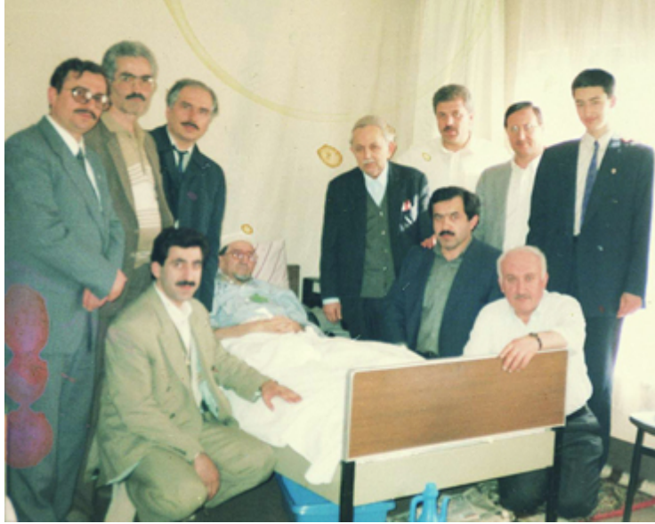
Hastanede, kendisini ziyaret eden dostları arasında...