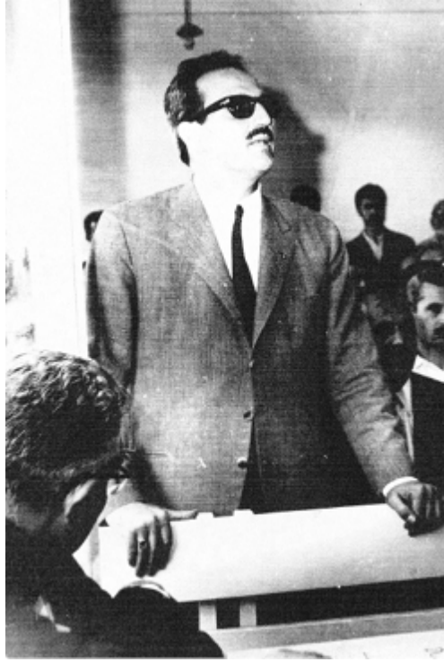
Hakkın ve hakikatin gür sesi savunmada... (İzmir, 1971) ve hakikatin gür sesi savunmada... (İzmir, 1971)

Hürriyetim, mesleğim bahismevzuu diye maznunlar vekili olarak söylediğim hakikatleri maznun sandalyesinde nasıl saklayabilirim? Benim için bu mümkün değildir. Hakikatin mahiyeti, konuşulan, durulan veya oturulan yere göre değişmez. Yerim değişti diye hakikat değişir mi?