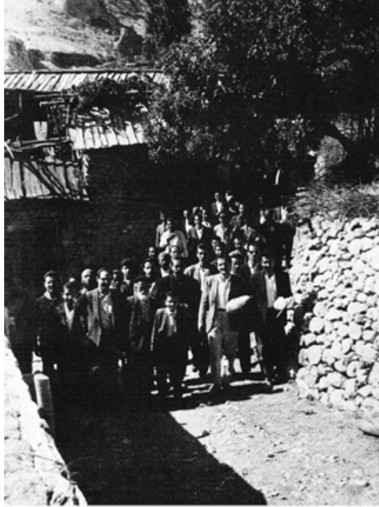
Nur dostlar arasında Barla hatırası...