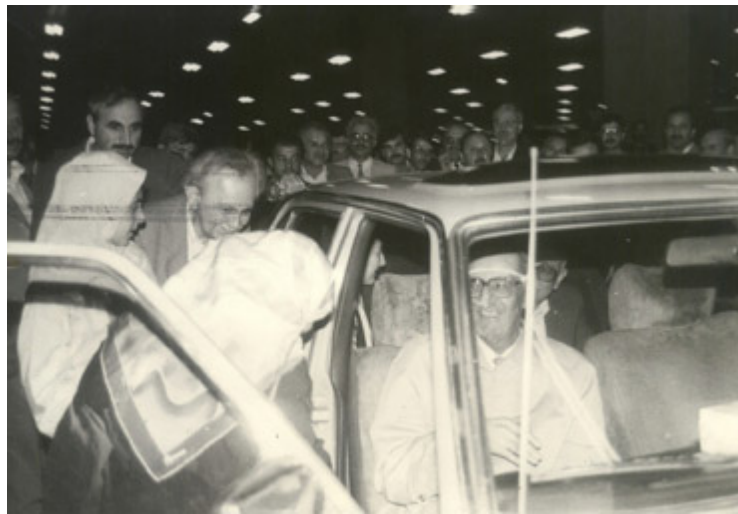
Londra dönüşünde, dostları tarafından havaalanında karşılanması...

O güne kadar kendisiyle hiç tanışmamıştım. Bu yüzden çok şaşırılmıştım. Fakat hizmetle ilgili herkesi bu kabil şeylerle onore ve motive etmek, onun âdetiydi. O zamanlar hacca gidebilme hayalim bile yoktu. Duasının bereketiyle 1994’te o mübarek topraklara gitmek nasip oldu!